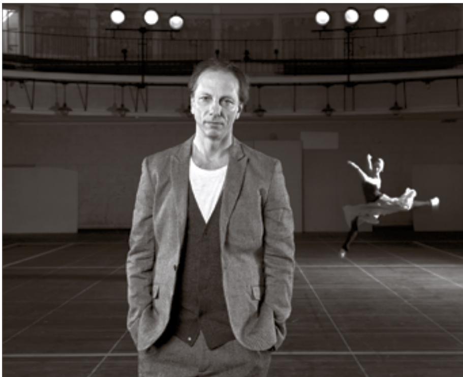
♦ Krzysztof Pastor To niesłychane, że udało się polski balet wyrwać z choreograficznego uśpienia

Zdradzi pan, czym jest pan w stanie zaskoczyć tancerzy Polskiego Baletu Narodowego?