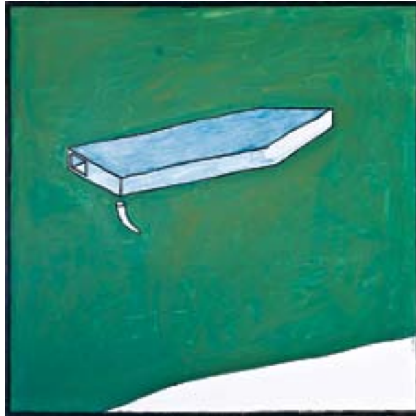
♦ Zupełnie nowa autostrada X , 2008, akryl, płótno 100x100 cm